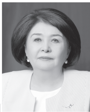
Робахон МАХМУДОВА, Олий суд раисининг биринчи ўринбосари

Чунки инсон шаъни, қадр-қиммати, ҳуқуқ ва эркинликлари ҳамда қонун билан қўриқланадиган манфаатлари айнан адолатли ва мустақил суд томонидан ҳимоя қилинади.